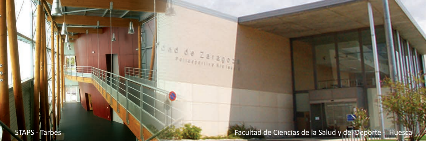
STAPS - Tarbes